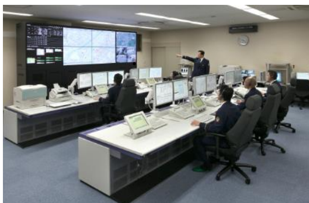
共同消防指令センター